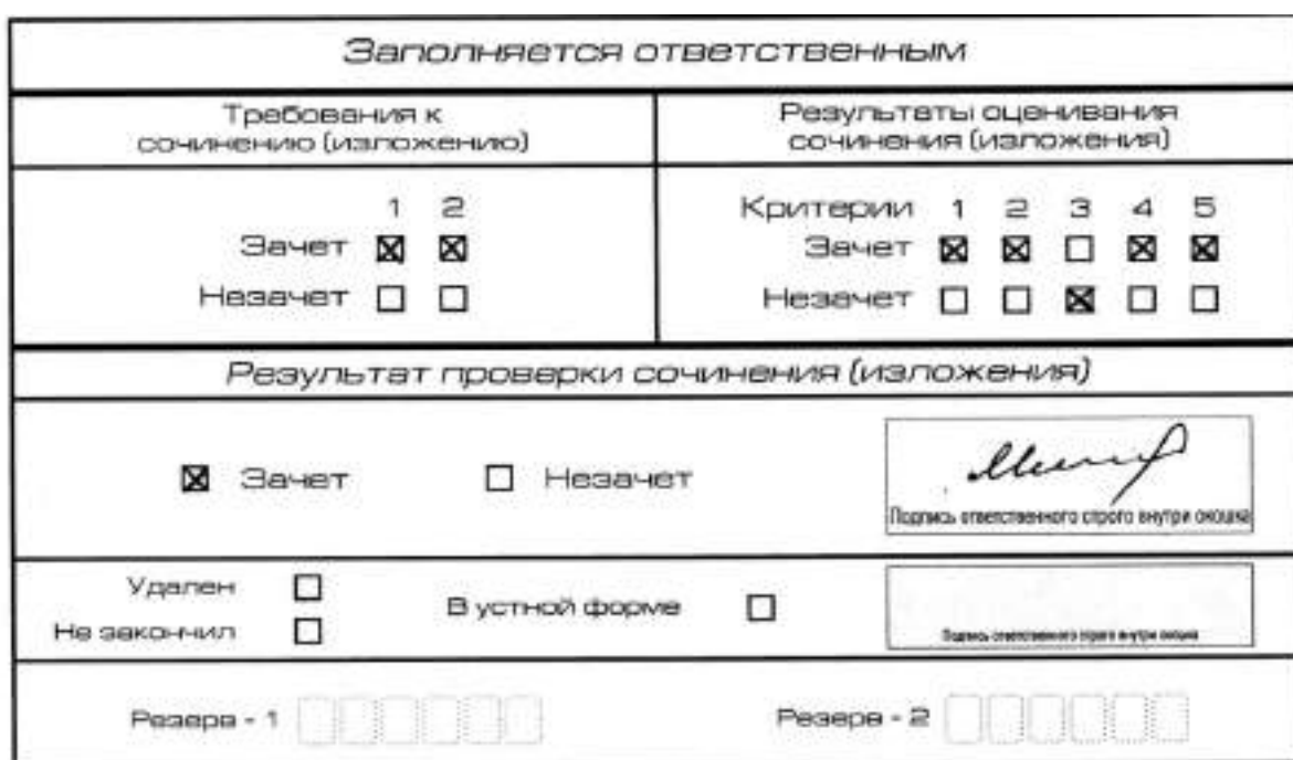
Рис. 10. Область для оценки работы

3. Во всех остальных случаях итоговое сочинение (изложение) проверяется по всем пяти критериям и оценивается по системе «зачет»/«незачет» (например, нельзя не проверять работу по критериям К4 и К5, если участник получил зачет на основании зачетов по критериям К1, К2, К3).