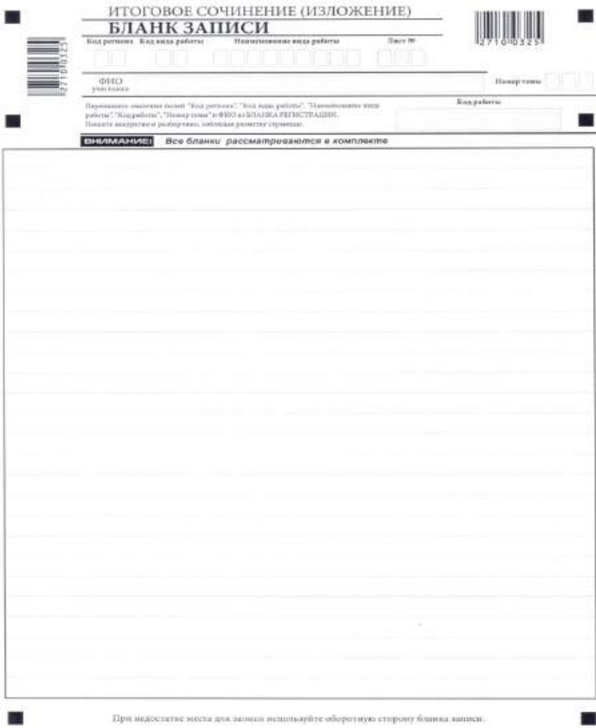
Рис. 5. Лицевая сторона двустороннего бланка записи