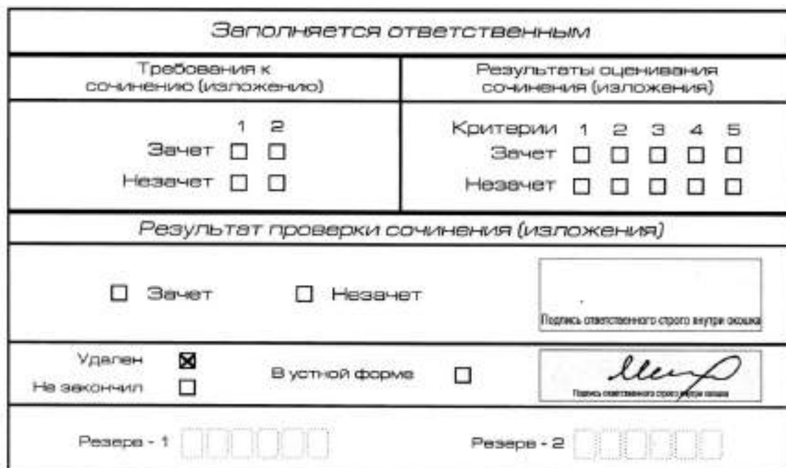
Рис. 13. Заполнение полей нижней части бланка регистрации (удаление с экзамена)