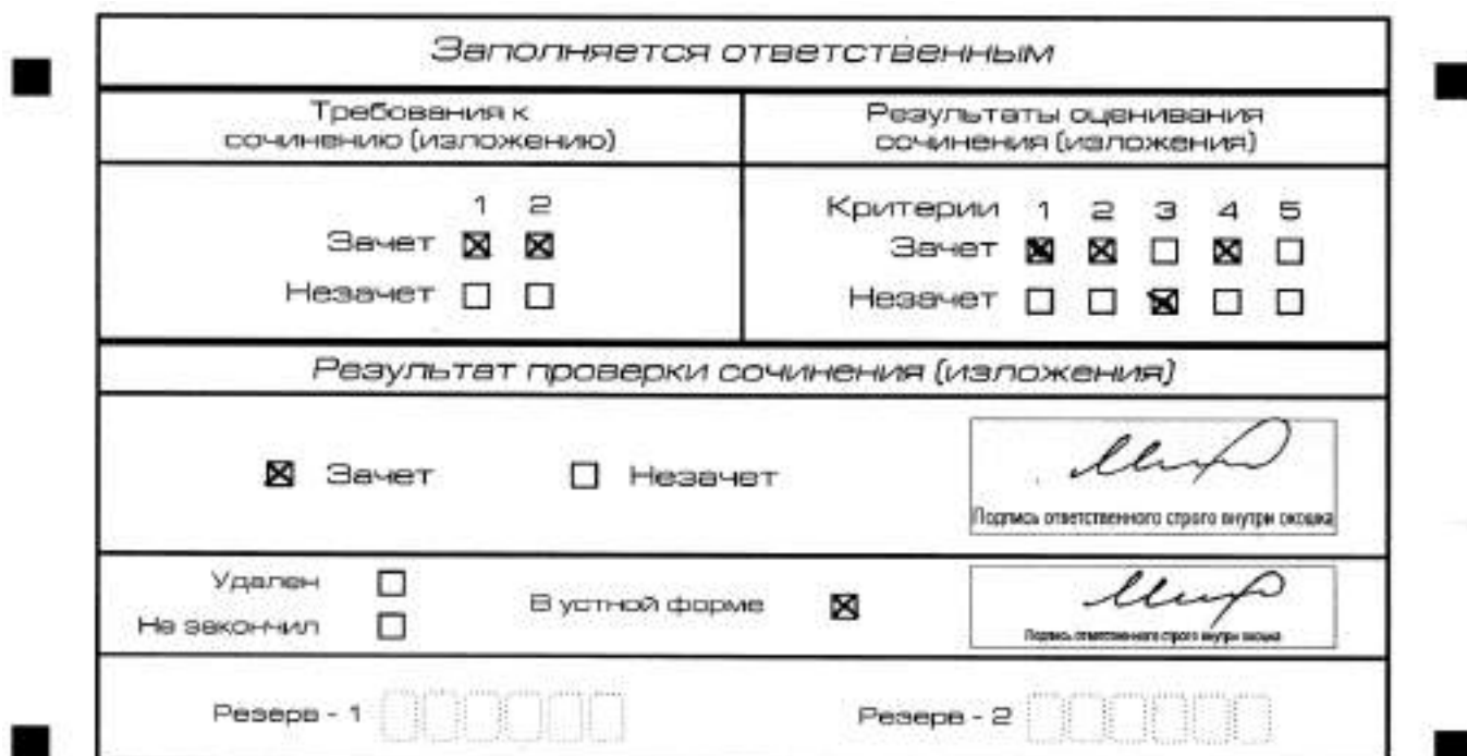
Рис. 11. Область для оценки работы сочинения (изложения) в устной форме

После окончания заполнения бланка регистрации ответственное лицо ставит свою подпись в специально отведенном для этого поле.